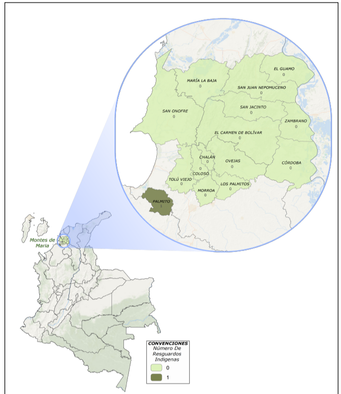
Gráfica 1. Total de eventos individuales ocurridos a población indígena durante el periodo analizado por municipio de ocurrencia