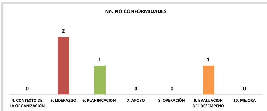
Gráfica No. 2. Número de No Conformidades