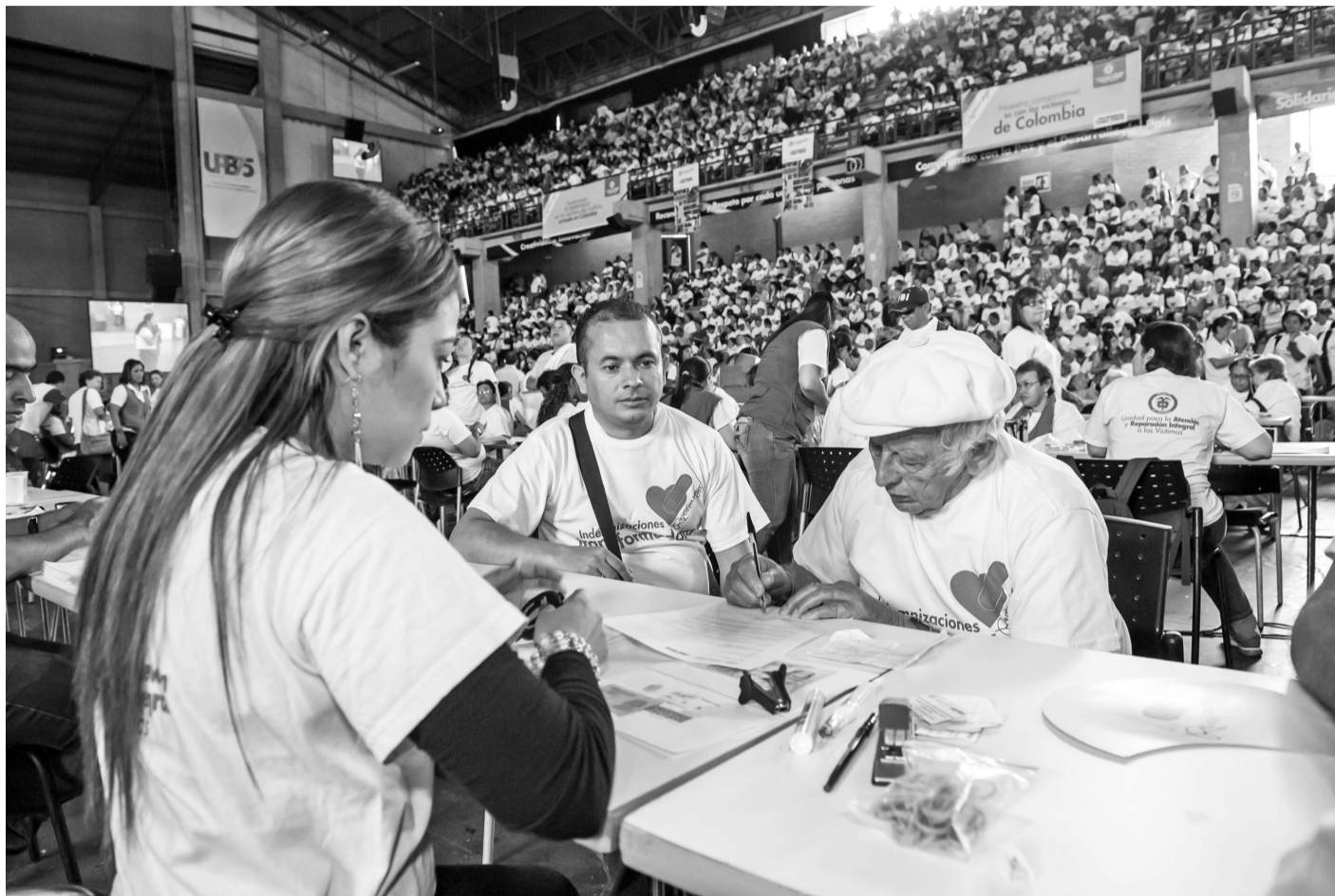
En la Unidad para las Víctimas se ha avanzado en la incorporación del enfoque para construir paz a través de jornadas de sensibilización frente al envejecimiento y la vejez que contribuyan al respeto, la comprensión y garantía de sus derechos.

Como parte de la Política de Atención y Reparación Integral a las Víctimas del Conflicto, se ha integrado el enfoque diferencial de Envejecimiento y Vejez con y para Personas Mayores, el cual se concibe como un principio rector en el artículo 13 de Ley 1448 de 2011 desde su dimensión individual y colectiva, que permite focalizar nuestra mirada y reconocer que hay poblaciones con características particulares en razón de su edad, género, orientación sexual y/o discapacidad. Es también un conjunto de medidas y acciones diferenciadas dirigidas a garantizar la igualdad material de estas poblaciones, las cuales permiten: i) enfrentar la situación de vulnerabilidad acentuada en el marco del conflicto, ii) contribuir a la superación de esquemas de discriminación, barreras sociales, exclusión, injusticias históricas, territoriales, entre otras; y iii) satisfacción de bienes, servicios y oportunidades.