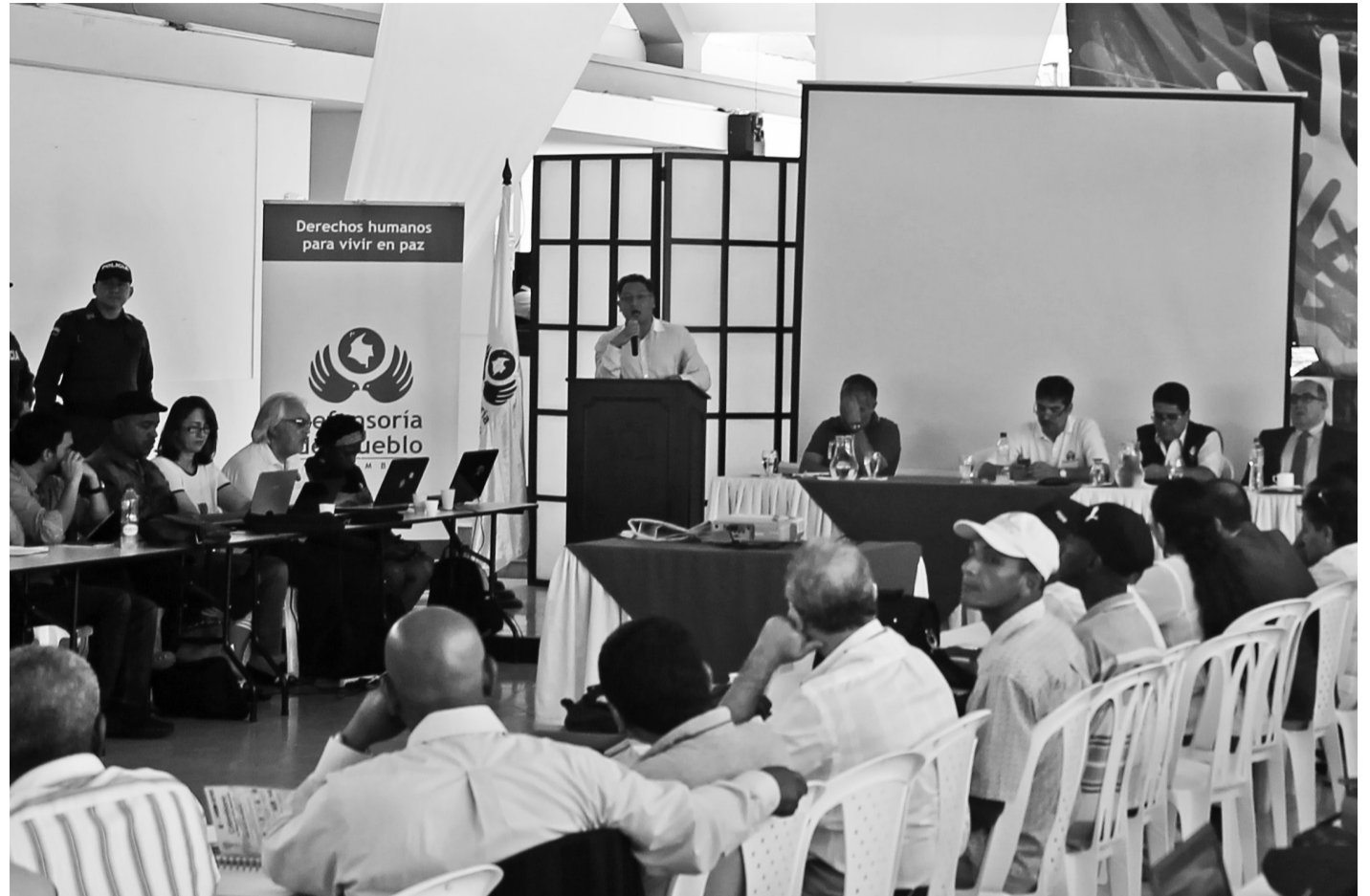
El resultado final es que todos los miembros de la Mesa Nacional, necesariamente deberán ser miembros de mesas municipales y departamentales, y representar todos los hechos victimizantes y los enfoques diferenciales.

Las nuevas mesas de participación efectiva de víctimas tendrán un protagonismo muy importante en el escenario de paz que se avecina. Serán una infraestructura social y deberán acentuar el trabajo con las administraciones para que queden plasmados y fortalecidos los programas de atención y reparación a víctimas en los planes de desarrollo locales, regionales y en el Plan de Desarrollo del Gobierno Nacional.