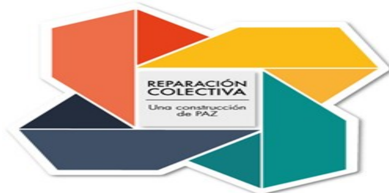
IMAGEN DEL PROYECTO